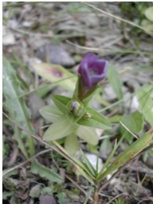
à observée le 20 août 2003 par Augustin ROCHE